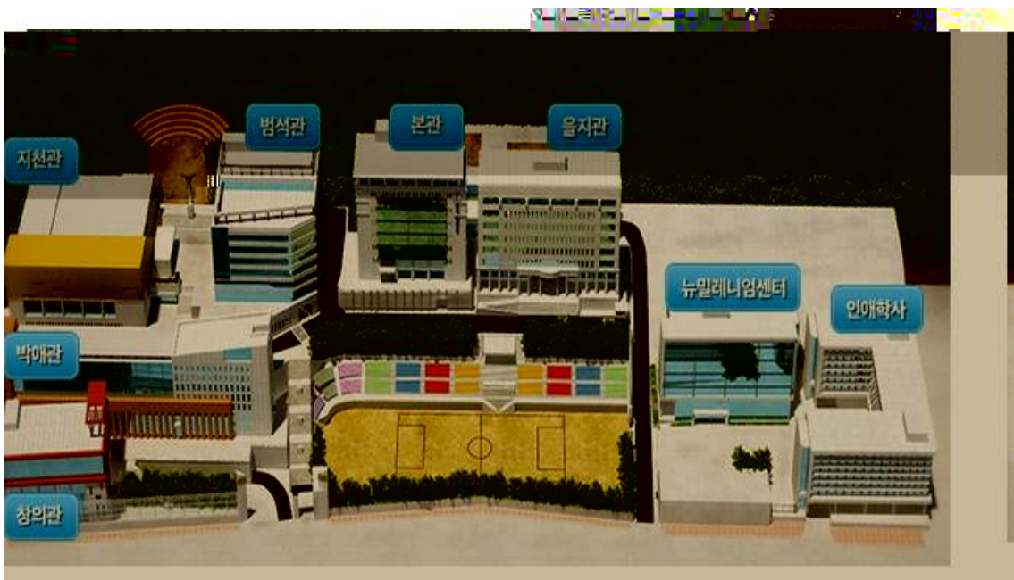
행사장소: 을지대학교 밀레니엄홀 (을지관 8층)